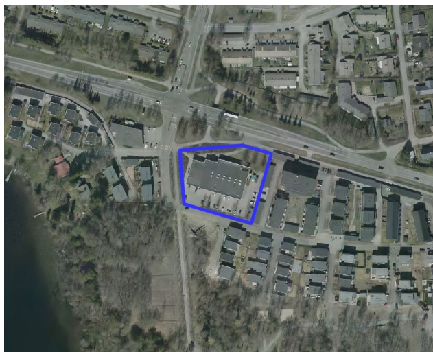
Kaavan suunnittelualue ilmakuvassa